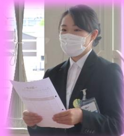
新入社員の皆さん