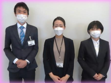
関西支社地域式 教育課の皆さま