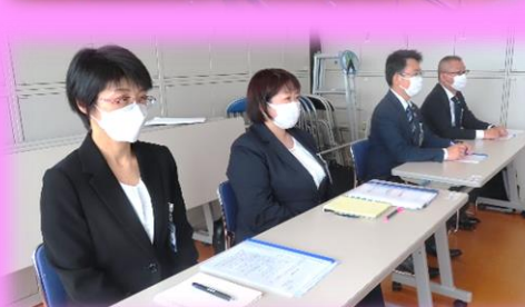
マツモトキヨシ労働組合執行部