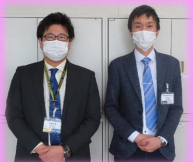
東海支社地域式 教育課の皆さま