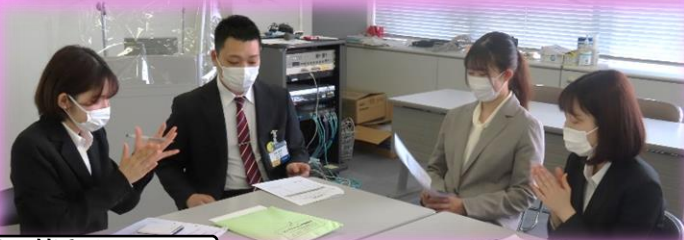
新入社員の皆さん